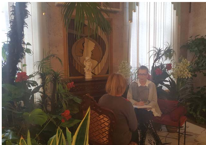
Ещё один уголок во Дворце бракосочетания, где медиатор может уединиться для разговора с одной из конфликтующих сторон

Уже первый опыт показал: даже когда нет полного примирения, медиация снижает накал агрессии в отношениях, помогает услышать друг друга и начать договариваться. Особенно это важно, если у пары есть дети. Они в любом слу-