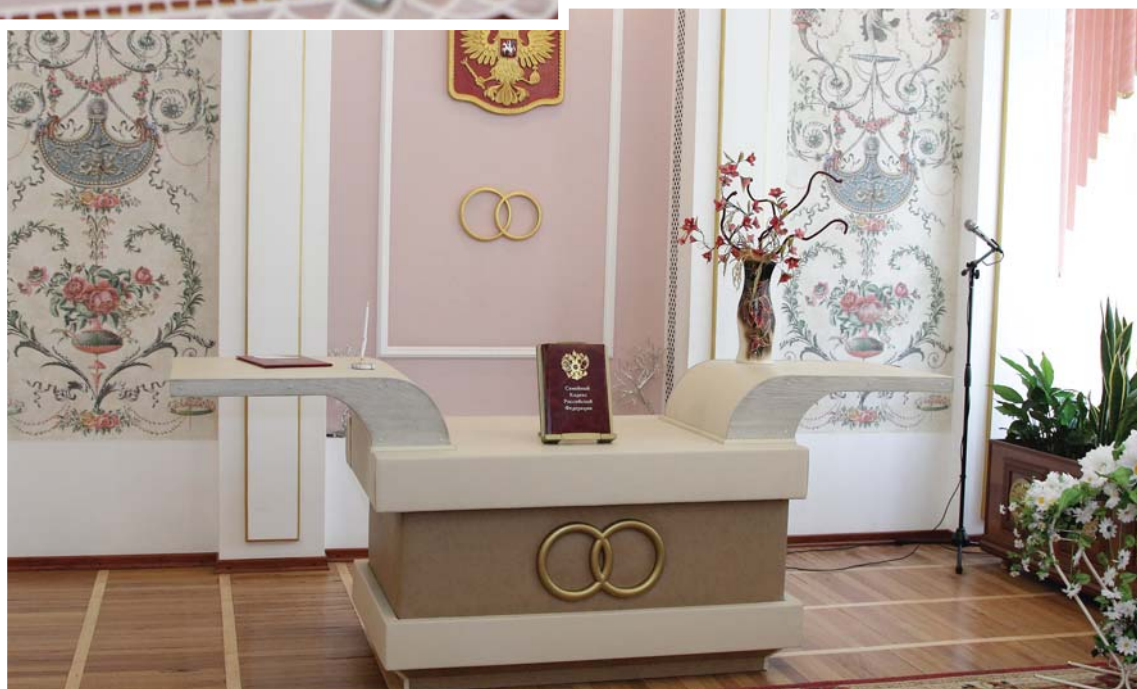
Интерьер малого зала Дворца бракосочетания, где расположена гостиная примирения

Во Владимирской области департамент ЗАГС областной администрации активно сотрудничает с некоммерческим партнёрством «Владимирская региональная ассоциация медиаторов» (НП ВРАМ), внедряя инновационные примирительные технологии.