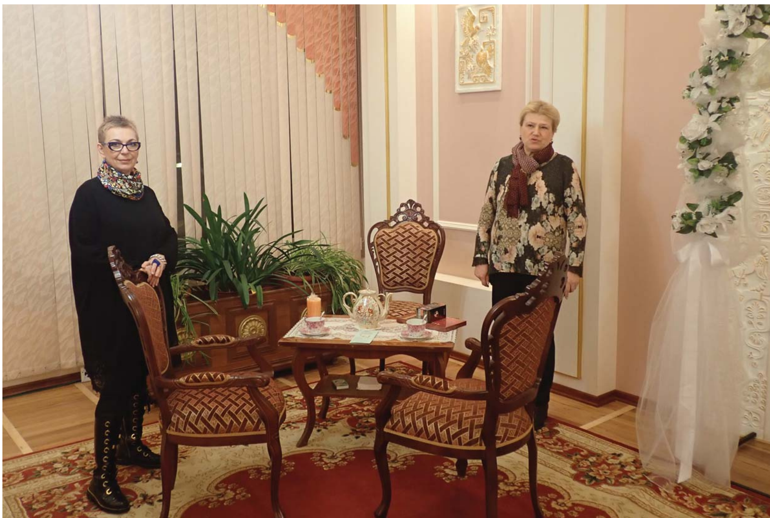
В гостиной примирения